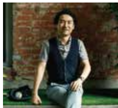
にしだ おさむ 西田司 (建築家)