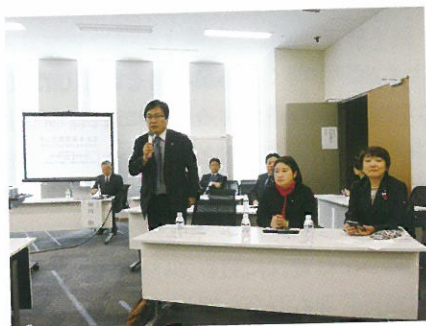
出席した国会議員のコメント

うことに対して大きなバリアになってしまう。建築基本法は一般の国民の中でどういう住まい方をしていくのか、を同時に議論しないと答えが出てこないということはあるが、問題を理解しているのは専門家側なので、専門家側から問題を投げかけ、みんなで議論してまとめていくことが必要だと思う」と締めくくった。